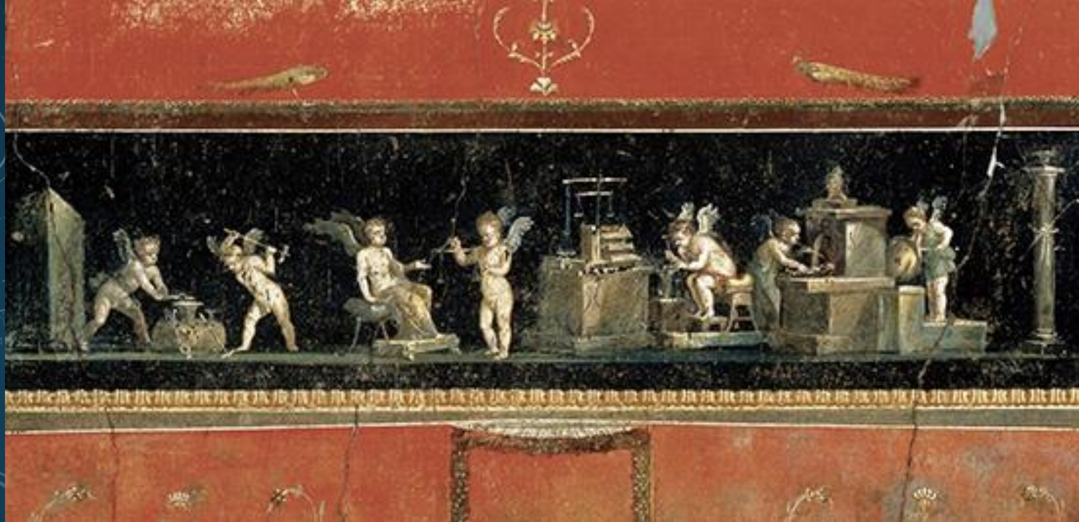
I profumi a Pompei